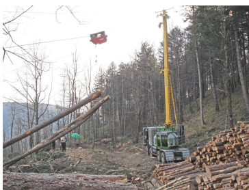
Valentini V1000 al lavoro