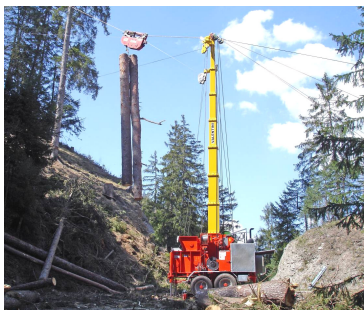
Valentini V600/M/3 all'opera

Attualmente il catalogo prodotti comprende cinque modelli di teleferiche a due o tre tamburi, per linee da 400 a 1.000 metri, che possono essere montate su rimorchi monoasse, doppio asse, cingolati o autocarri specifici. Il modello più piccolo (V400) è stato ideato per il montaggio su trattore. La gamma di teleferiche VALENTINI offre la possibilità di scegliere il modello più adatto alle esigenze del cliente,