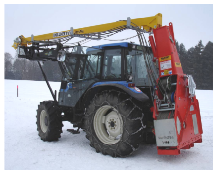
Valentini V400 su trattore

realizzando su richiesta anche macchine speciali.